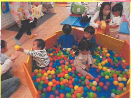
ボールプールで遊ぼう！