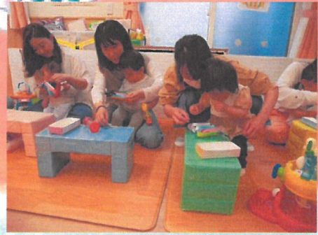
うろこのシールをペタペタ貼りました