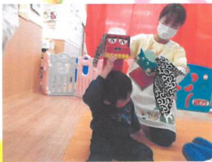
うわっ〜! ✨ ガブっ!