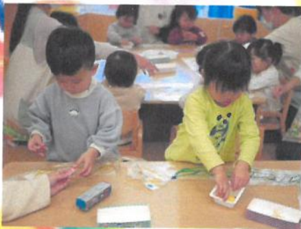
シール貼りに夢中です💡