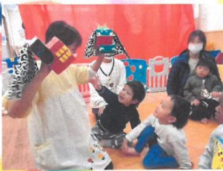
獅子舞と辰獅子舞だ〜 🍴