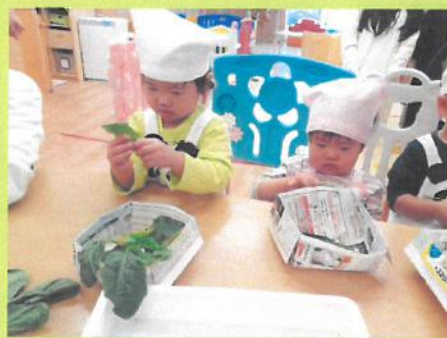
ほうれん草ちぎちぎのお手伝い🌱