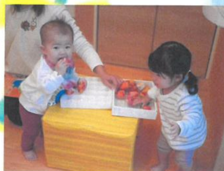
お手玉 🟡 🟠 🟢 詰め詰め 🎵