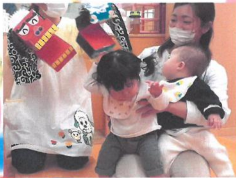
ちょっぴり怖いよ〜❤️