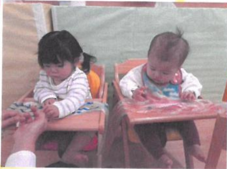
シール貼ってます💡