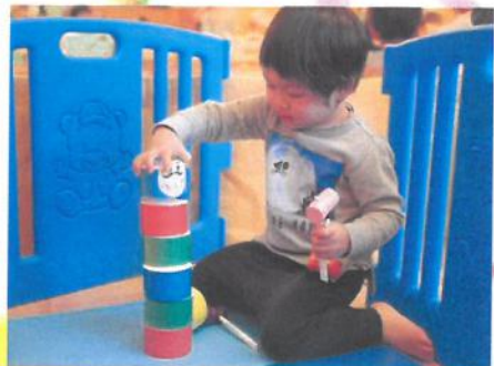
だるま落としに挑戦 🎵