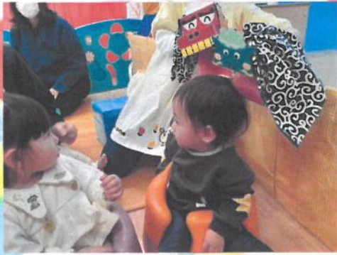
ドキドキしちゃうね〜❤️