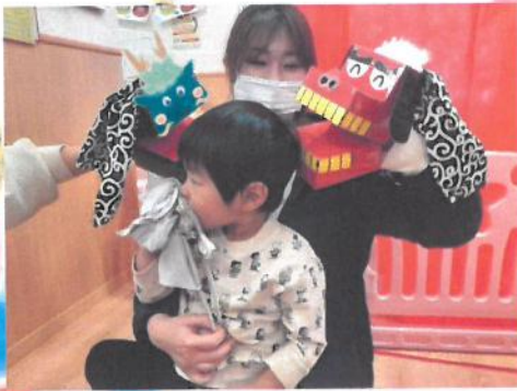
ガブガブ～ 🍴 ✨