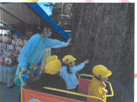
今年もよろしくお願いします 🍡 ❤️

今日は八幡神社に初詣に行きました🍡 ✨ お賽銭を入れてお願いをしたりご神木に触れてパワーをもらったりと楽しくお参りすることが出来ました🎵 今年もみんなが元気に過ごせますように・・・ 🍡 ❤️