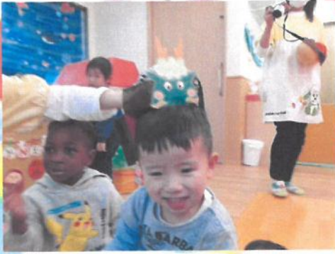
面白い～ ✨ もっと噛んで～ 🍴