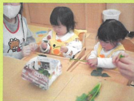
ひよこ組さんも上手だね