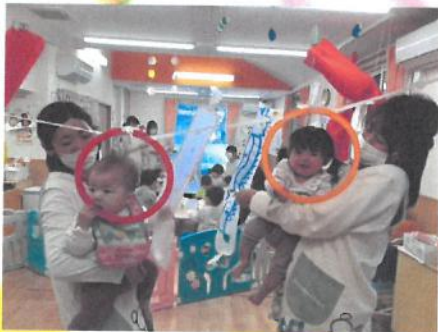
飛行機持って…ばあ〜😊