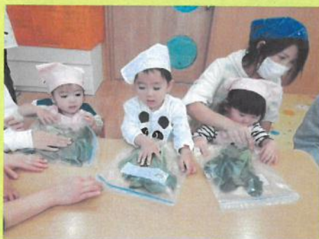
同じように見えるけど違いが分かるかなあ〜🌱