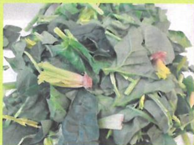
ほうれん草ちぎちぎのお手伝いありがとう(^^♪たくさんできました🌱