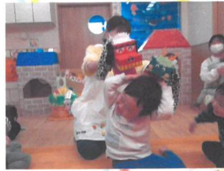
きゃ〜 😊 パク! ✨