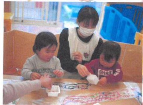
好きな色を選んでます💡