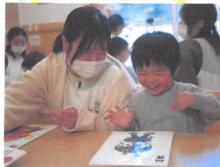
できたよ〜 😊 バイキンマンの福笑い 🎵