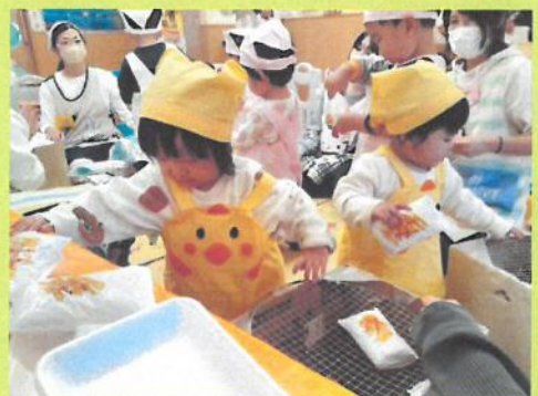
五平餅作りごっこ