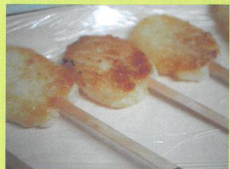
午後のおやつ「五平餅」の完成🍡