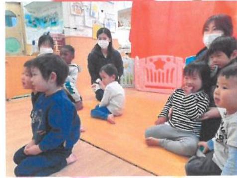
ぱんだ組さんの様子 🐼