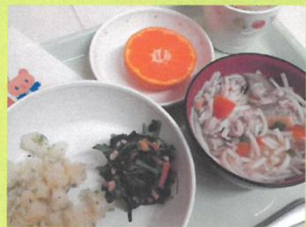
本日の給食「ほうれん草と人参の納豆和え」