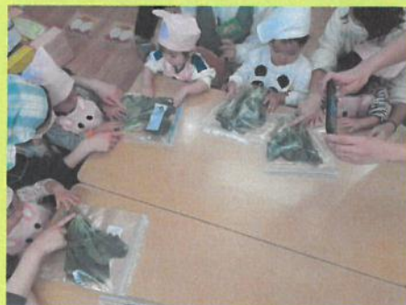
ほうれん草・小松菜・青梗菜・春菊の観察