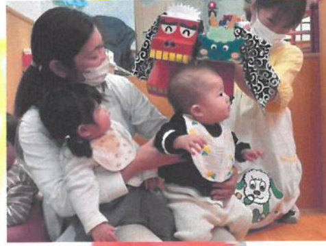
ひよこ組さんの様子 🐣 パクパク〜 🍴