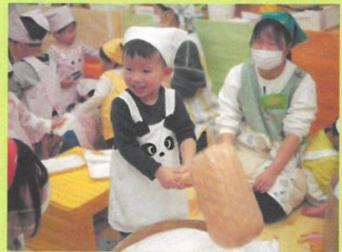
お餅作りごっこ遊び