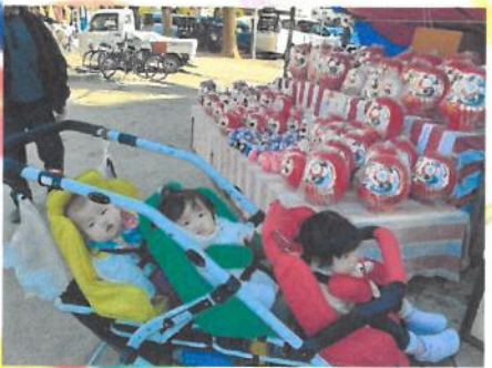
だるまさんがいたよ 🍡 ❤️