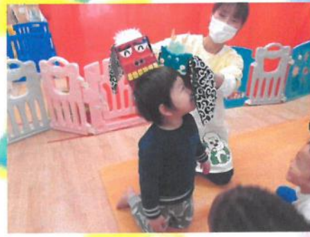
怖くないよ〜 😊 ✨