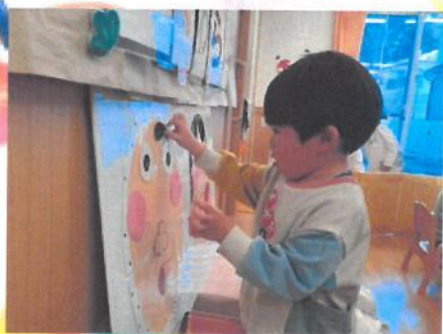
福笑い 🎵 😊