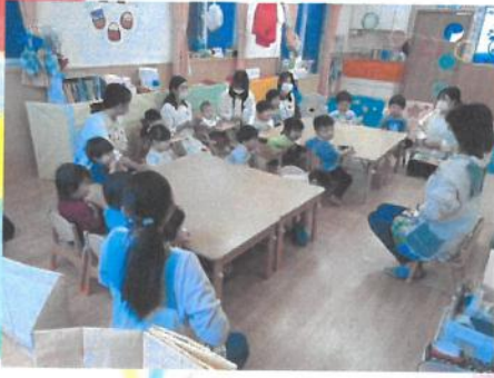
昔遊びの紹介にみんな興味津々👁️💡