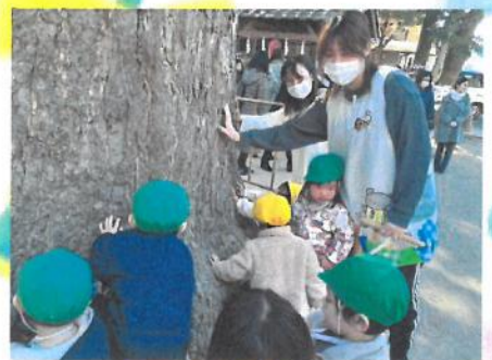
ご神木に触れてパワーをもらおう 🍡