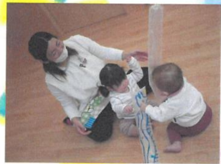
ふくらませてもらって👁️👁️