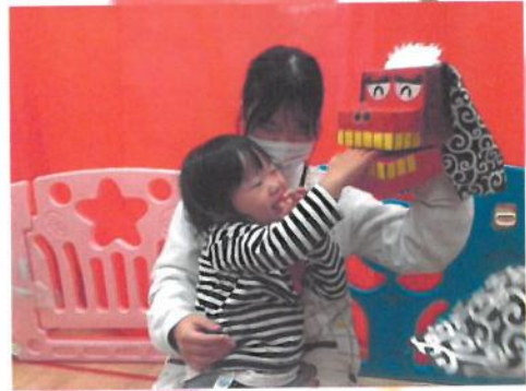
おててをパクっ 🍴 ✨

今日は、ぴよぴよ教室に参加して ✨ ✨ お正月の獅子舞パペットを見ました 🍴 ✨ 獅子舞と辰獅子舞に頭をかぶると噛まれると厄除け、学力向上、無病息災、健やかな成長のご利益があるという言い伝えがありますので ✨ みんなも、獅子舞に頭をかぶってもらいました 😊 🍴 🍴 今年1年健やかに成長し元気に過ごせますように 🍴 🍴