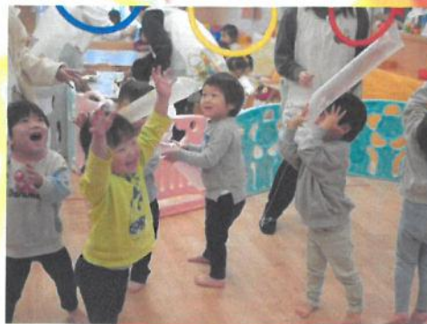
それ〜~~~~!! 😊 飛んだ〜