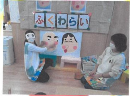
先生が福笑いに挑戦!! 😊