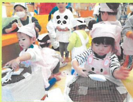
熱いけど気を付けて焼こうね