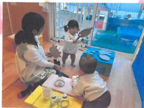
でんでん太鼓&けん玉 🎵