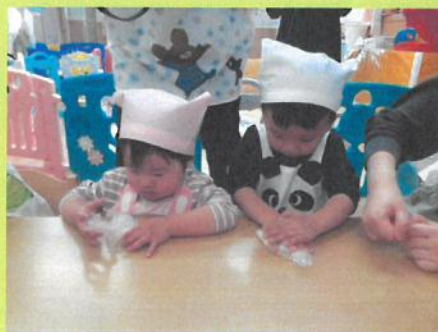
午後のおやつ「五平餅」作りのお手伝い🌈