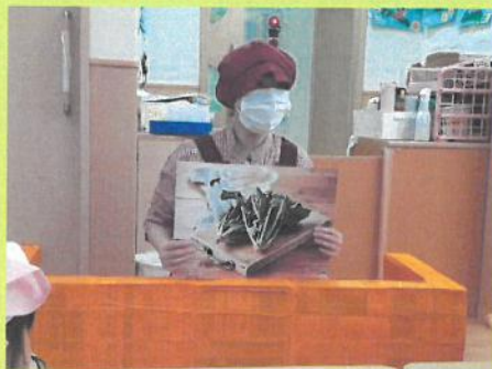
ほうれん草の紙芝居